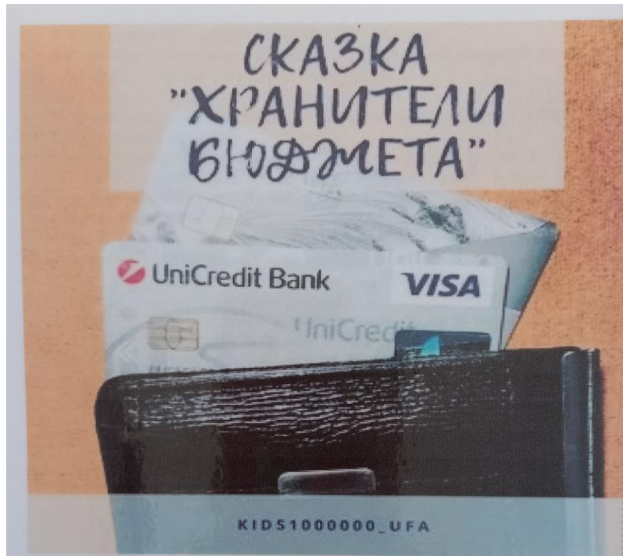
Сказка «Хранители бюджета»

Жил да был Кошелёк. Он любил, когда его бережно открывали, доставая денежные купюры. Их он хранил в разных своих кармашках. Крупные купюры лежали в особом отделе и под замочком. Их использовали для покупок крупных вещей, продуктов, игрушек, приобретения мебели, оплаты за квартиру, свет, газ. Те, что были меньшего достоинства, лежали в другом отделе. Их использовали для покупки билета на проезд, газет, пирожков и