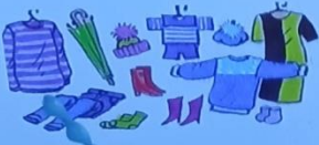
Товары и услуги